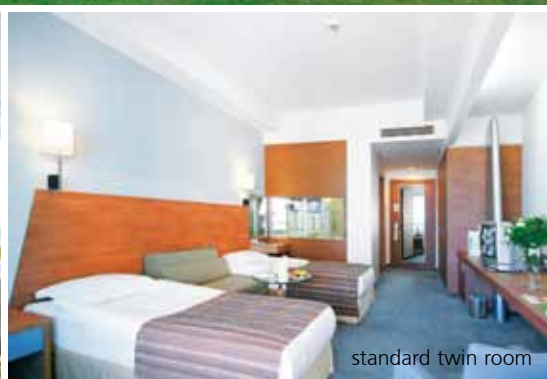
standard twin room